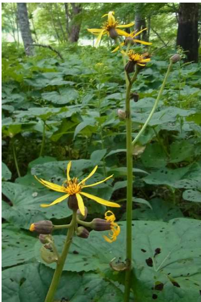
8/7 マルバダケブキ(千手)