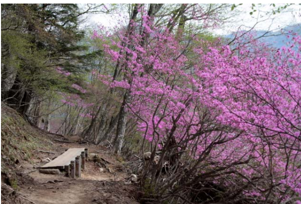
5/20 トウゴクミツバツツジ (中禅寺湖)