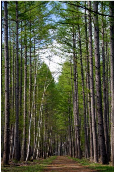
5/19 新緑のカラマツ林(西ノ湖)