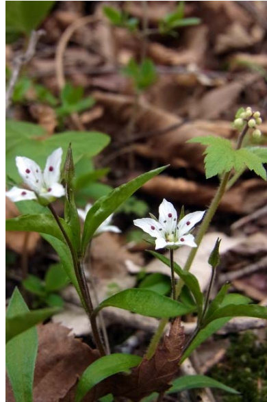
5/20 ワチガイソウ(中禅寺湖)