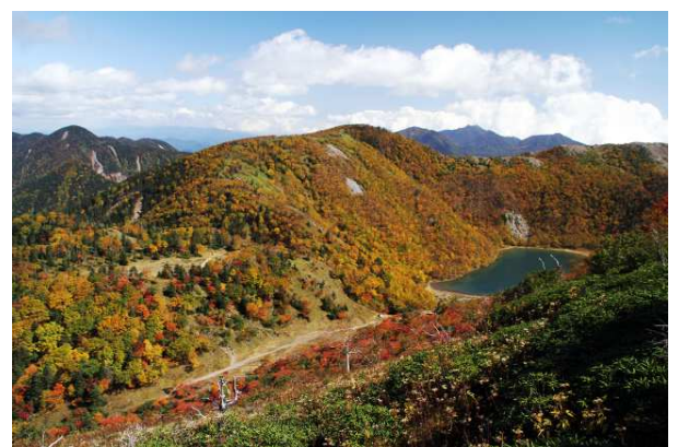
10/5 五色沼遠望(白根山)