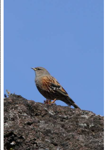
10/5 イワヒバリ(白根山)