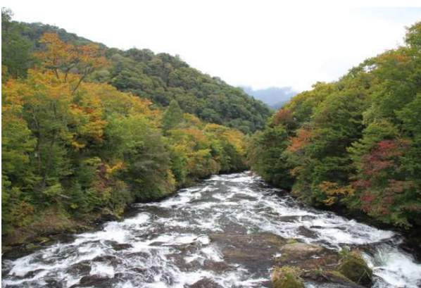
10/3 竜頭滝 滝上