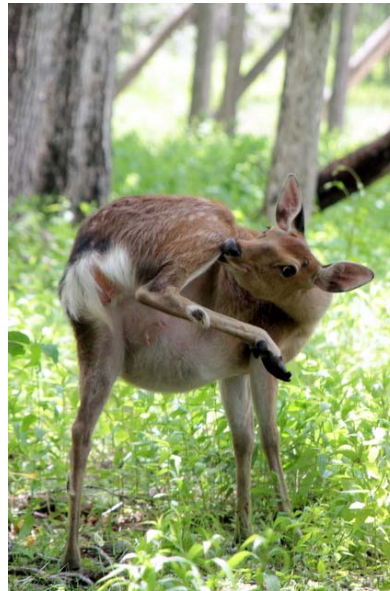
6/13 ニホンジカ(西ノ湖)