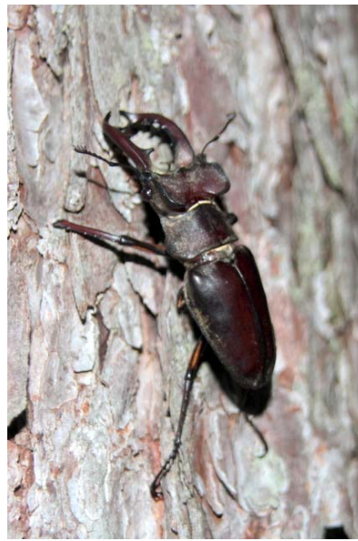
8/11 ミヤマクワガタ(三本松)