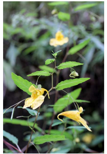
8/15 キツリフネ(湯ノ湖畔)