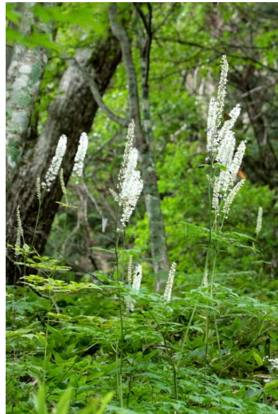
9/2 サラシナショウマ(戦場)