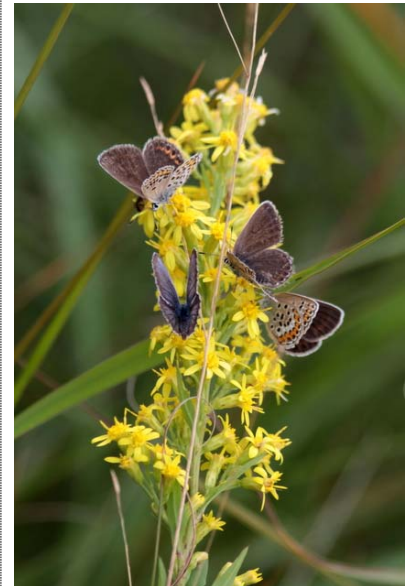
9/5 アキノキリンソウとヒメシジミ(戦場)