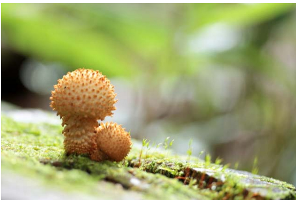
9/2 スギタケモドキ (湯川)