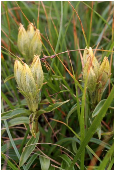
8/31 トウヤクリンドウ(奥白根)