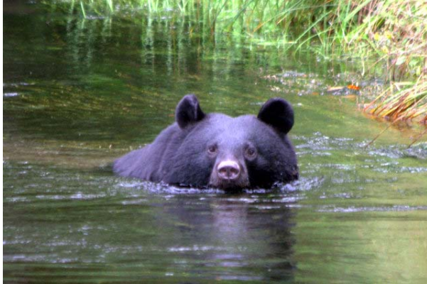
9/15 ツキノワグマ (戦場)