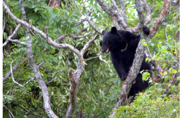
9/15 ツキノワグマ (戦場)