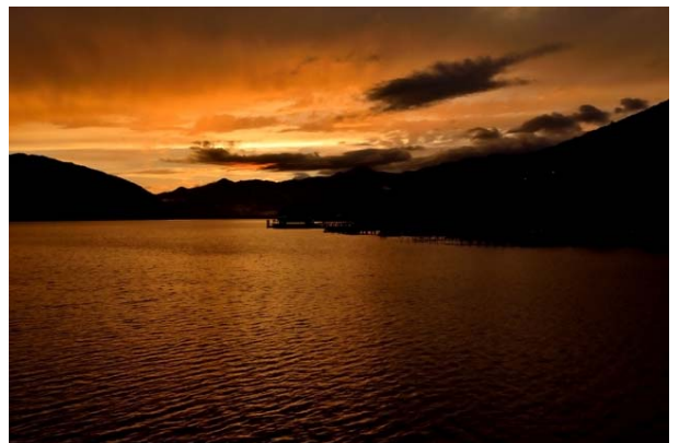
中禅寺湖9月夕景