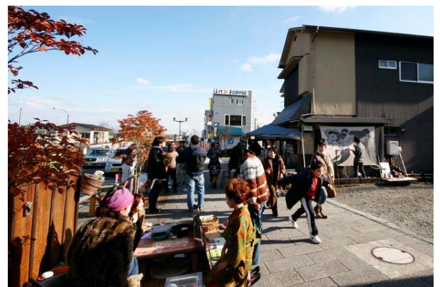
11/16 秋の日光マルシェ