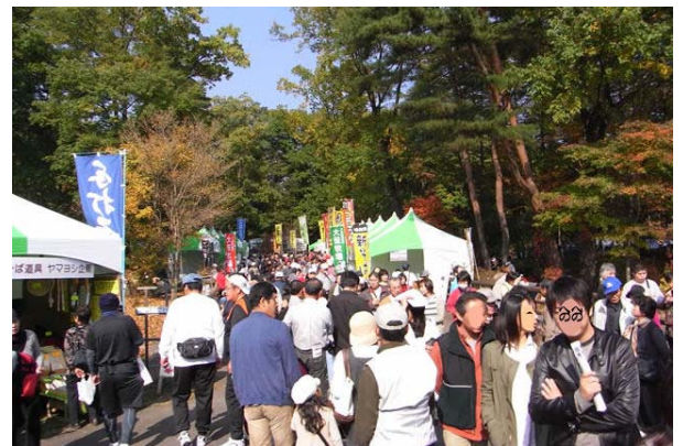
11/22~24 日光そばまつり(だいや川公園)