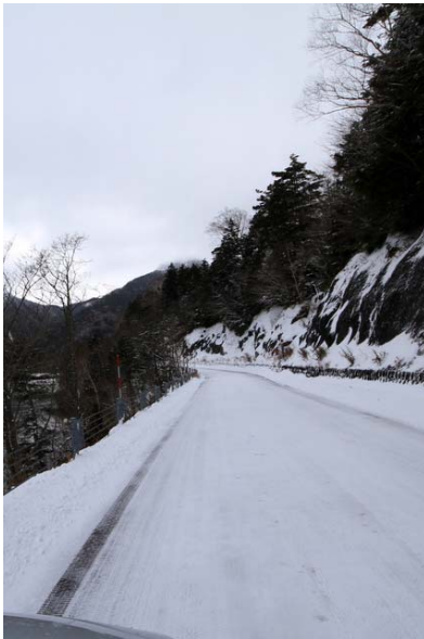
11/16 金精道路 (群馬県側)

11/15、11/19、湯元温泉も降雪・積雪したが、11/21時点ではいろは坂方面から湯元までの日中の路面状況に心配はない。但し、上記の降雪翌日、金精峠の栃木県側では日中に雪が融け走行可能な状態になったにも関わらず、トンネルを抜けた群馬県では同時刻に一面真っ白な状態が続いていた。金精峠越えは冬用の装備が必要となる。オオワシ・オジロワシとも低公害バスの運転手が目撃したとの情報が入った。今年の中禅寺湖にハジロカイツブリの姿を多く見かける。他の湖沼にもカモ類の数が増えた。11/21 菅沼から奥白根に上がる。積雪は全行程で5cm程。アイゼンを要する程ではないが、岩の上に積もった雪が滑りやすかったり、トレースで一部凍結しかけている場所もあったため、歩行には注意を要する。弥陀ヶ池・五色沼とも凍結。同日朝、菅沼近辺は-8度であったとの事。今後の登山には冬装備が必要となる。夜間の冷え込みが厳しい日が増えてきたが、早朝の戦場ヶ原などでは霜が一面を真っ白く染め上げ、陽光と共に宝石箱の様に煌めく様が頻繁に見られるようになった。