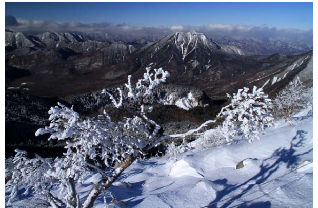
12/15 男体山頂より太郎山