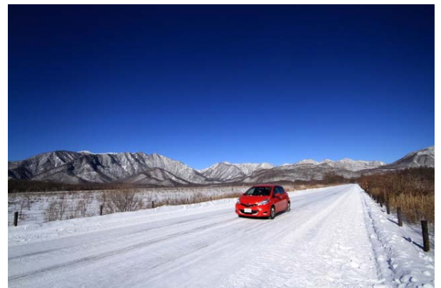
12/19 国道120号 戦場ヶ原