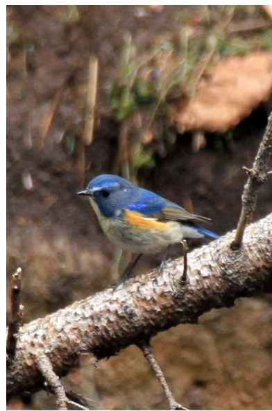
4/22 ルリビタキ(湯川沿い)