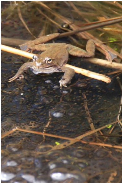
4/21 ヤマアカガエル(戦場)