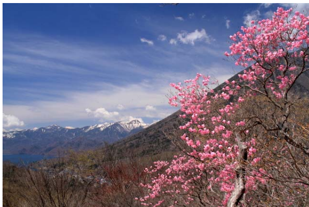
4/30 アカヤシオ見頃(明智平付近)