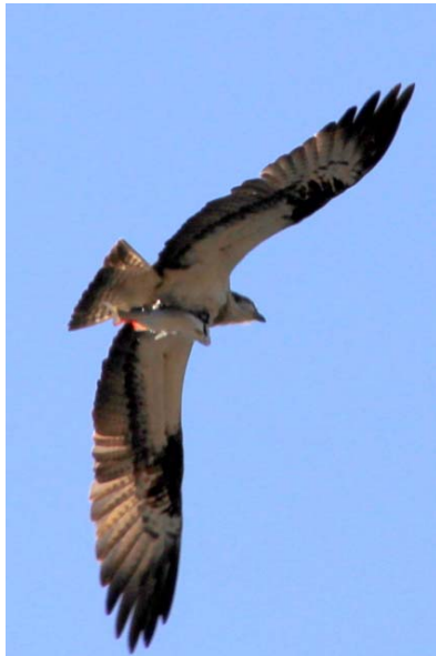
4/26 ミサゴ(湯ノ湖上空)

5/1 湯ノ湖・湯川の釣りが解禁。湯ノ湖周回線歩道は一部残雪があるが通行可。刈込湖一周コースを除き、他の遊歩道ではほぼ雪も消え、トレッキングシーズン到来。当館ガイドが浅田舞さんをご案内した【にほんのトレッキング Best20!】が再放送される。同番組内で奥日光は 12 位にランクイン。5/10(日) 15:00~16:30 NHK-BS にて。