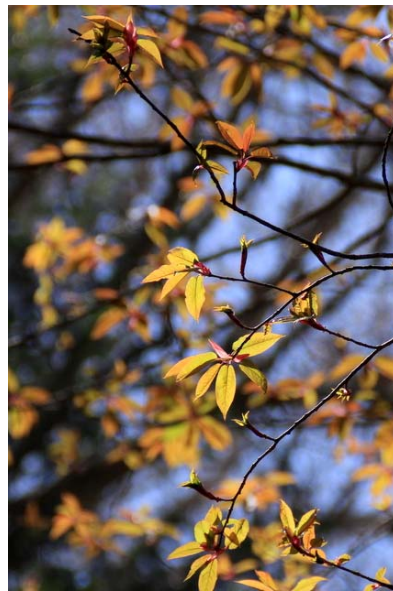
4/26 シウリザクラ展葉(千手ヶ浜)