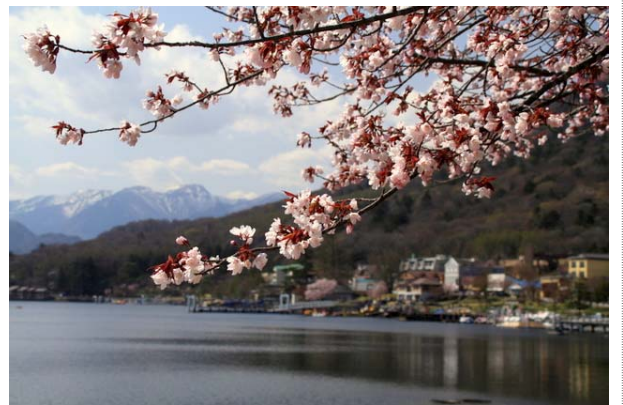
5/1 オオヤマザクラ開花(中禅寺湖畔)