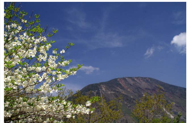
5/15 シロヤシオ見頃(明智平付近)