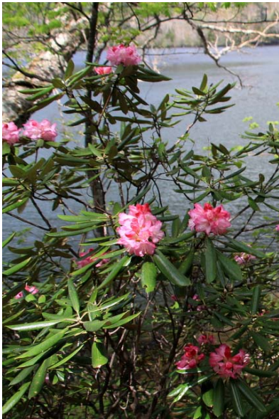
5/15 アズマシャクナゲ (湯ノ湖)

5/11 太郎山（新薙→山王峠）に登った。樹林下は残雪と土道を繰り返し、アイゼンを必要とするほどではない。お花畑周辺の林内が雪に覆われていて、不慣れだとルートが取りづらい可能性がある。新薙入口付近でアズマシャクナゲ開花。花数多し。開花速度の速さは現在も継続され、例年よりも1週間から10日早いまま。トウゴクミツバ…湯ノ湖：七分、中禅寺：ややピーク過ぎ、竜頭：綻び。 シロヤシオ…中禅寺：七分。熊窪周辺は今週末最盛。 アズマシャクナゲ…湯ノ湖：見頃。花数多いが開花状況に個体差があり、蕾から見頃まで様々な状態を長く見られる。中禅寺湖畔にてエゾハルゼミ・カジカガエル鳴く。ミヤマカラスアゲハ視認、クマバチが盛んに縄張りを示す。湯ノ湖の浅い岸边ではウグイの産卵行動が見られる。クリンソウは極一部開花。過去の状況から類推すると、月末・月初辺りに見頃か？ 5/17-18 と東照宮の例大祭が行われる。今年は400年記念式年でもある為混雑が予想される。市街地に用が無い場合は、有料道清滝IC～日光IC間を使い迂回すると良い。