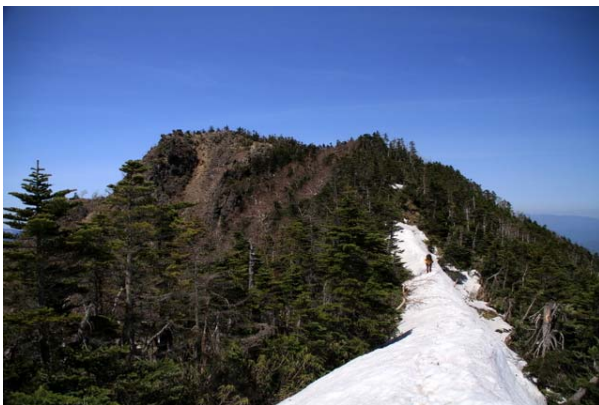
5/11 太郎山尾根(小太郎方面より太郎山)