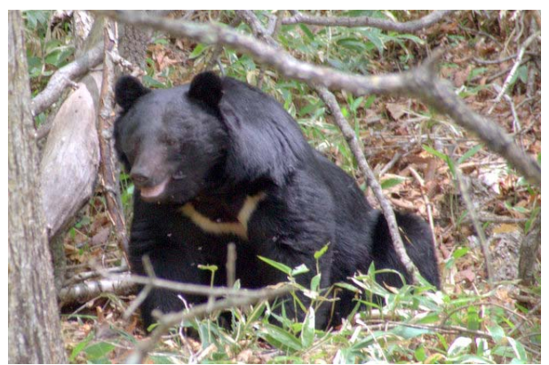
5/28 ツキノワグマ(三岳南麓)