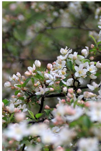
5/28 ズミ (戦場ヶ原)