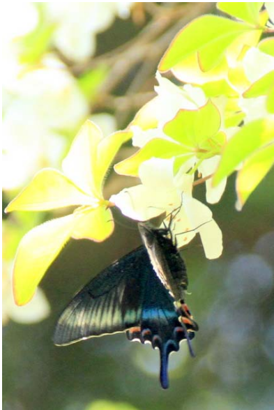
5/27 ミヤマカラスアゲハ(高山)

三岳南麓でクマの目撃が3日続いたが、その後目撃が途絶えた。現場付近に誘因となる食糧があり、それを食べていたのではないかと推測される。奥日光はその全域がクマの生息域であるが、目撃が集中する時は何らかの理由がある可能性がある。過剰に恐れる必要はないが、最新の目撃情報を集める事で遭遇率を下げる事が出来るだろう。エゾハルゼミの鳴声はその盛りを迎えたようで、実に賑やか。 ズミが戦場ヶ原・湯元で見頃を迎える。今季は開花が若干ずれている様なので、週半ばから来週末頃までは楽しめるのではないかと推測される。開花期には穏やかに甘く香る。 ワタスゲは次の週末頃からか。千手のクリンソウもその数を増してきているが、盛りまではもう少し。川沿いの一部で六〜七分、庭で五分か。こちらも次の週末に見頃へ。 5/30 から丸沼高原の Gondola、並びに湯元⇄丸沼高原間の無料シャトルバスが運行される。シャトルは丸沼施設利用者のみ。 問：0278-58-2211 丸沼高原総合案内