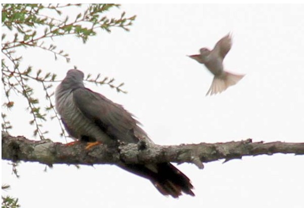
5/28 威嚇される？カッコウ(戦場ヶ原)