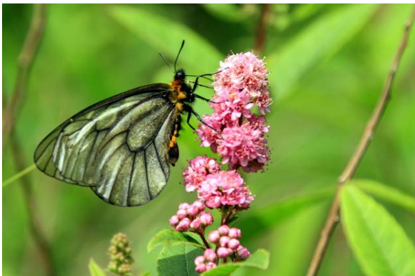
7/2 ホザキシモツケとウスバシロチョウ(戦場)