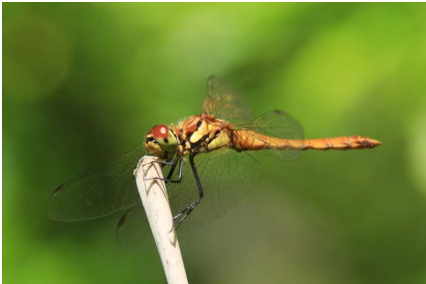
6/29 アキアカネ飛来(戦場ヶ原)

今年は霧降高原園地のニッコウキスゲが素晴らしい。下段は盛りを過ぎているが、全体で1445段ある階段の内、800段付近からの斜面がオススメ。最上部までの登りは平均40~50分程かかるので、時間に余裕が欲しい。まだ蕾も残るので7/11~12頃までは十分に楽しめるだろう。7/3~6はやや離れた駐車場から無料シャトルが運行される。また、日光駅からの路線バスは一時間に一本程度なのでスケジューリングに注意。戦場ヶ原ではホザキシモツケの開花が始まり、アヤメやウマノアシガタ、ハクサンフウロなど夏の花が開花。また、ウラギンヒョウモンやフタスジチョウ、ミヤマクワガタなども活動を始め、夏の様相を呈してきた。当年生まれの仔鹿の姿を見かけた。戦場ヶ原木道沿いでクマハギを多く見かける。目撃情報は少ないが、早朝夜間は注意。