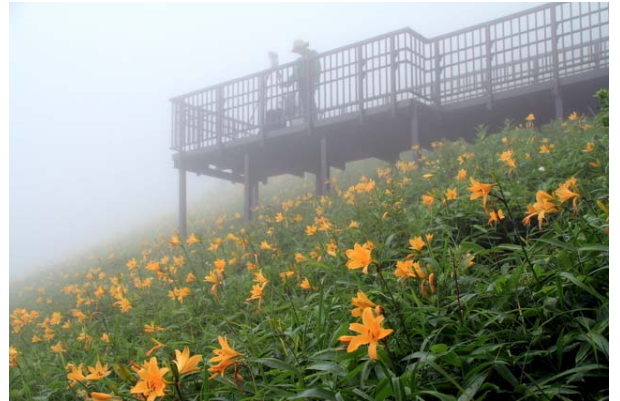
7/2 ニッコウキスゲ見頃(霧降高原)