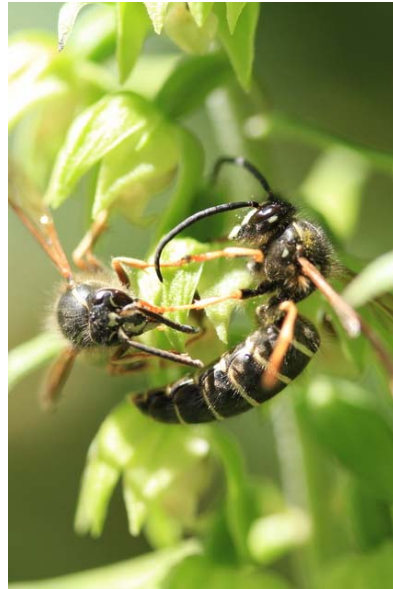
7/25 エゾスズランとホオナガスズメバチ