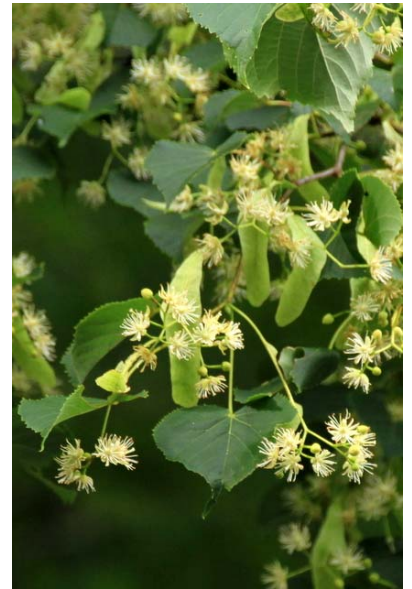
7/25 シナノキ(湯滝付近)