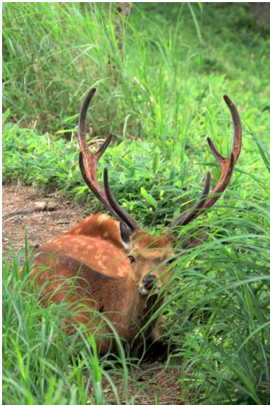
8/1 オスジカ (阿世瀉峠)