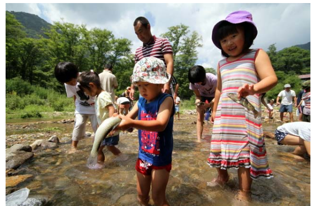
8/13~15 マスの掴み取り (湯元白根沢)