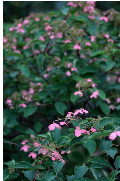
8/31 ノリウツギ色づく(湯ノ湖)