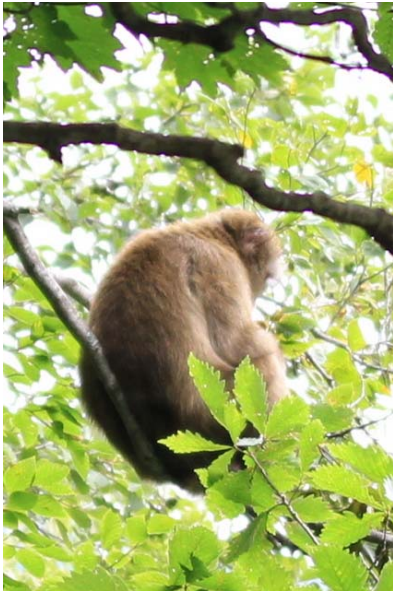
8/31 採食中の猿(湯ノ湖)

9/4~9/13 道の駅日光にてオクトーバーフェス開催中。ドイツのビールや食事が楽しめる。