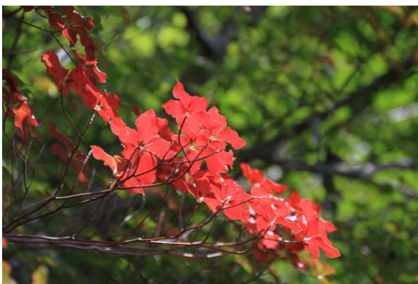
9/4 シロヤシオ紅葉(中禅寺湖北岸)