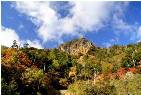
9/28 金精山 紅葉見頃