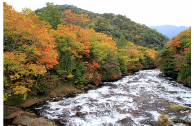
10/1 竜頭滝上 黄葉見頃、紅葉六分