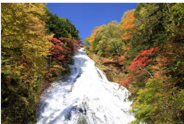
10/9 湯滝 紅葉見頃