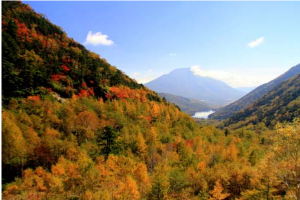
10/6 金精峠 紅葉見頃、黄葉七分

奥日光のほぼ全域で紅葉が見られる。この週末の見頃は湯ノ湖の位置する 1500m 帯から上、標高 1800m くらいまでか。標高は低いものの冷気の集まる竜頭滝も見頃。カラマツの黄葉は、冷気が溜まりやすい戦場ヶ原では見頃に差し掛かるが、金精峠や山王峠などの高標高エリアでも緑のクスマミが残る。小田代の金屏風は週半ば以降か。中禅寺湖の八丁出島も色づくが、見頃まではもう少し。こちらは来週末ごろだろうか。随所で、オスジカがメスを求めるラッティングコールが物悲し気に響く。湯ノ湖にはキンクロハジロやヒドリガモが飛来。 10/3 戦場ヶ原で初氷観測。