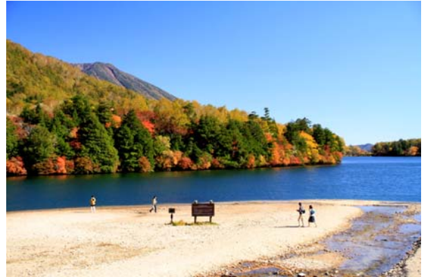
10/7 湯ノ湖 見頃