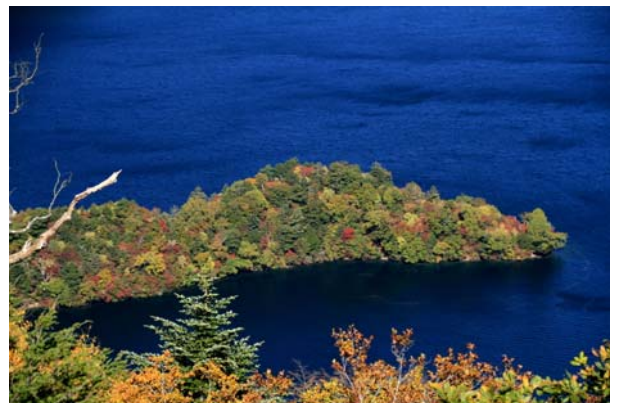
10/7 八丁出島 六分