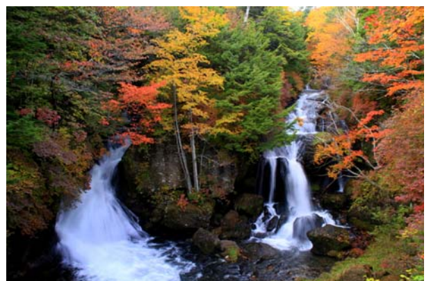
10/9 竜頭滝 紅葉見頃