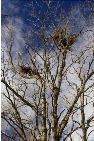
10/27 クマダナ (赤沼付近)

概略 先週 25 日に吹き荒れた木枯らしで、奥日光の紅葉はほぼ吹き散らされ、名残を残す程度。紅葉前線はいろは坂より下がったが、10/27 時点での東照宮界限では六分程と感じられた。週明けか半ば辺りから見頃に入ろうか。 10/30~11/1 の間、世界遺産を照らすライトアップ日光が開催されている。また輪王寺庭園の逍遥園(10/25~11/15)、清滝養鱒場(10/24~11/15)でもライトアップが行われ、夜間にも紅葉を楽しむ事が出来る。 葉を落とした奥日光は冬枯れの森。見晴らしの良くなった森では、随所でクマダナ(熊の採食痕)を見る事が出来る。赤沼~竜頭滝上までの国道沿いにも多くあるので、ドライブ方々眺めてみるのも良い。 カワマス産卵時期となった。小砂利の溜まった川床で産卵床を作る雌、その雌を守る第一位の雄と、雌を狙う他の雄との追いかっけが見られ、なかなか飽きない。湯滝下の浅瀬、小滝の橋上、湯川沿いの歩道が観察の適地。 例年ならば山頂、時に湯元でも雪が降る季節。峠越えをする際は天気予報に注意。