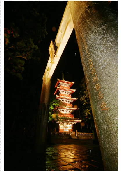
ライトアップ日光