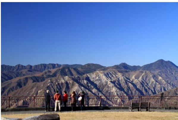
10/26 半月山第二駐車場より足尾方面