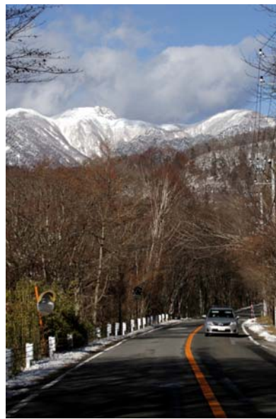
11/27 国道120号線(中禅寺湖畔)