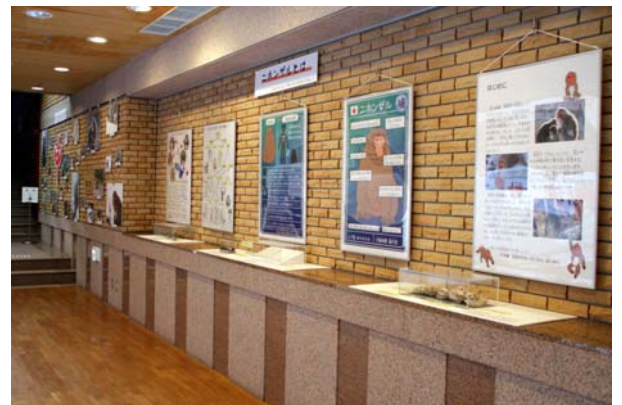
日光自然博物館 干支展「日光のサル」