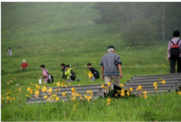
7/1 ニッコウキスゲ(霧降高原キスゲ平園地)