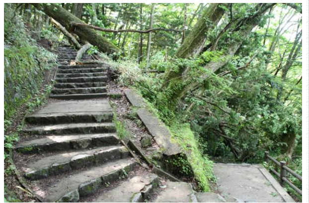
7/10 湯滝横階段歩道 倒木の為通行不可