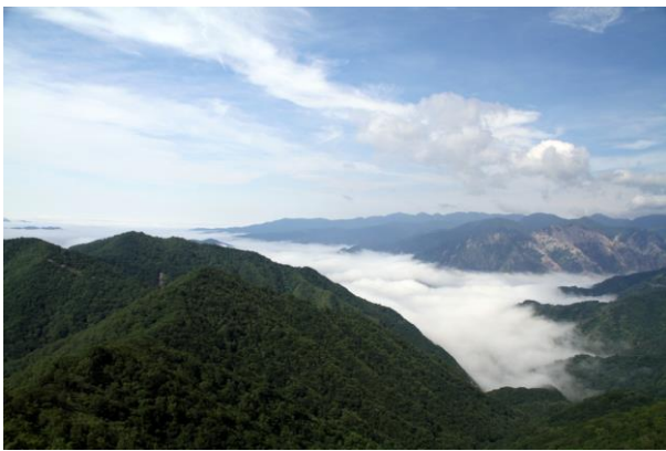
7/6 半月第二駐車場より足尾方面雲海