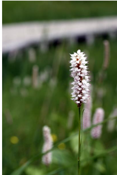
7/4 イブキトラノオ (戦場)