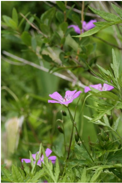
7/4 ハクサンフウロ(戦場)

7/16・17の両日、中禅寺夏の元気まつりと称して、日光自然博物館前庭などを中心にコンサートや産直物販売の出店などが出る。また、7/16には同博物館にて企画展が二つ（昆虫展、コウモリ展）が始まるので、併せて楽しみたい。