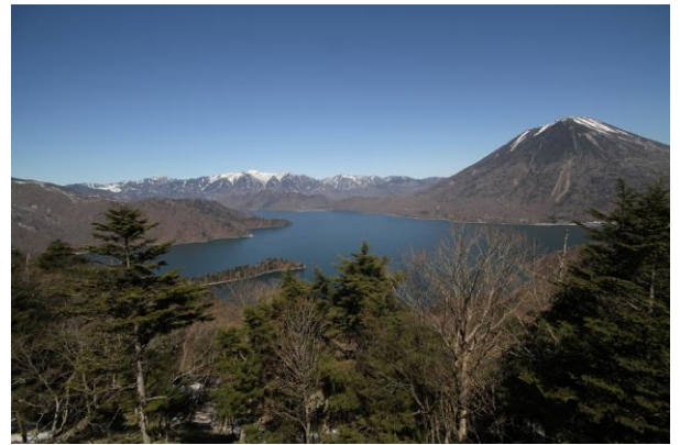
中宮祠足尾線第一駐車場より