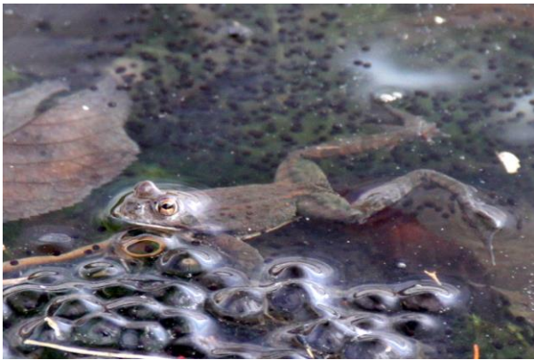
4/16 ヤマアカガエルと卵塊(湯元)