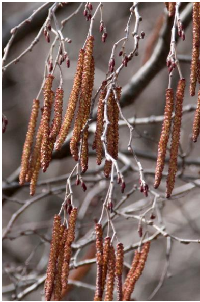
4/12 ハンノキ花序(竜頭滝)