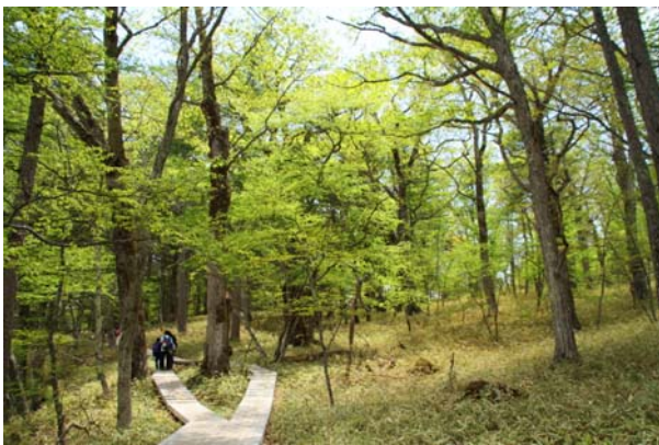
6/6 新緑の歩道 (戦場ヶ原)