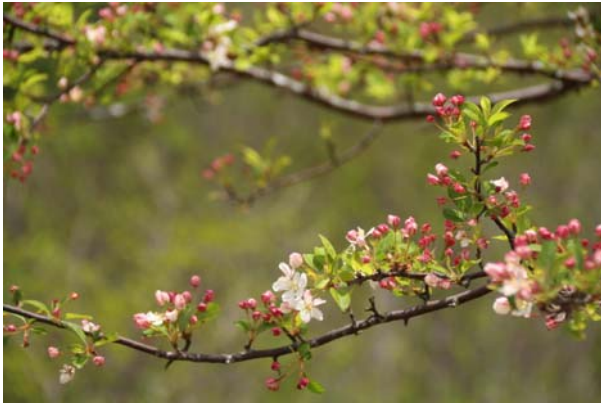
6/6 ズミ (戦場ヶ原)