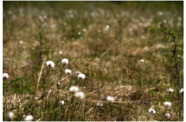
6/6 ワタスゲ (戦場ヶ原)