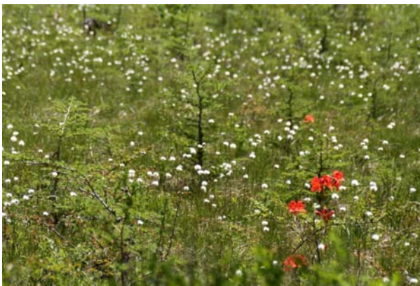
6/20 ワタスゲ・レンゲツツジ(戦場ヶ原)