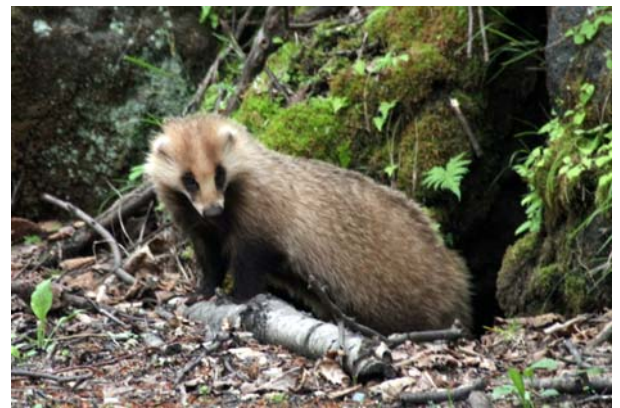
6/23 アナグマ(湯ノ湖畔)