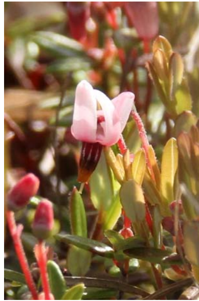
6/22 ツルコケモモ(戦場ヶ原)