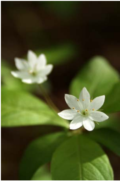
6/22 ツマトリソウ(戦場~小田代)