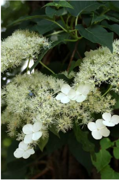
7/7 ツルアジサイ(湯元)