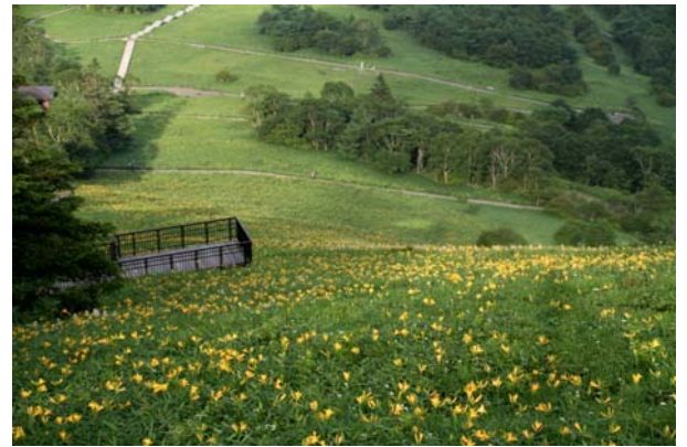
7/7 ニッコウキスゲ見頃(霧降高原)