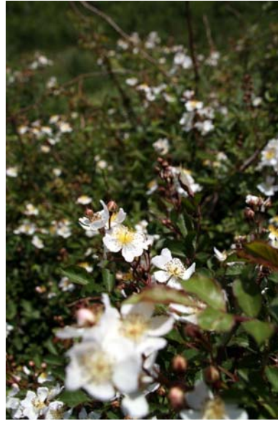
7/7 ノイバラ見頃 (戦場ヶ原)