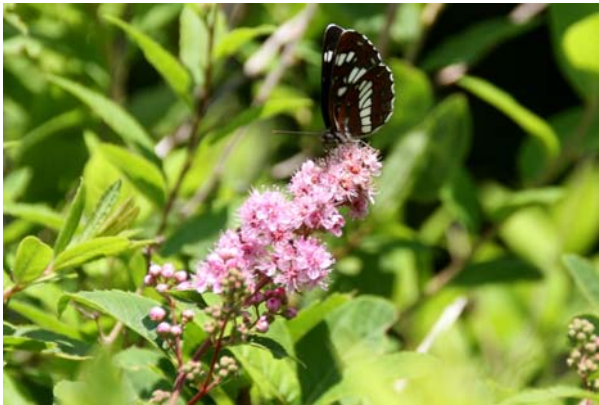
7/7 ホザキシモツケとフタスジチョウ (戦場ヶ原)