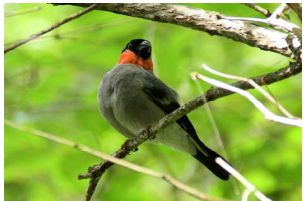
8/5 ウソ (男体山)