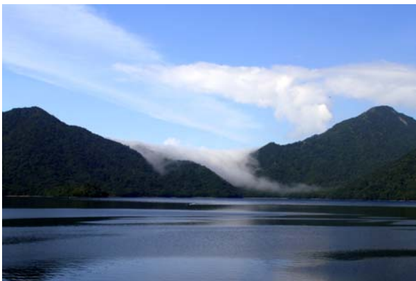
8/4 阿世瀉峠より滝雲