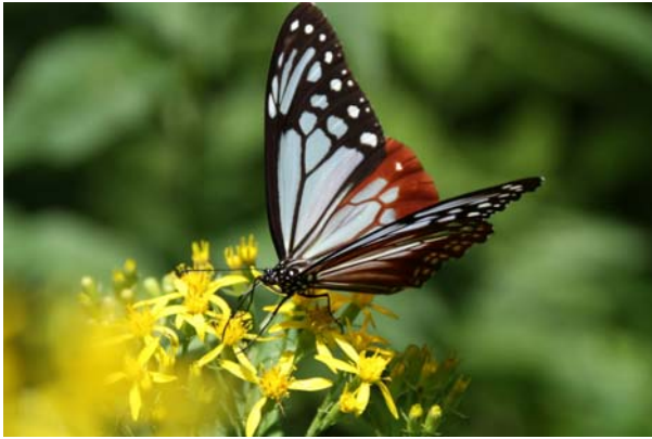
8/2 キオンとアサギマダラ (庵滝)