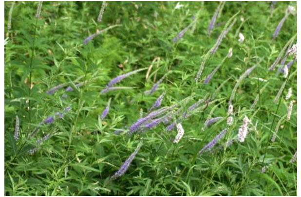
8/2 クガイソウ(小田代原)