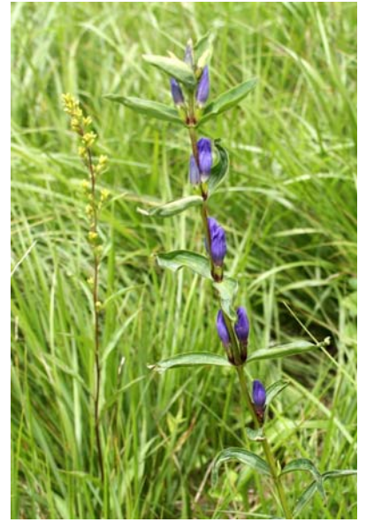
8/22 エゾリンドウ(戦場)