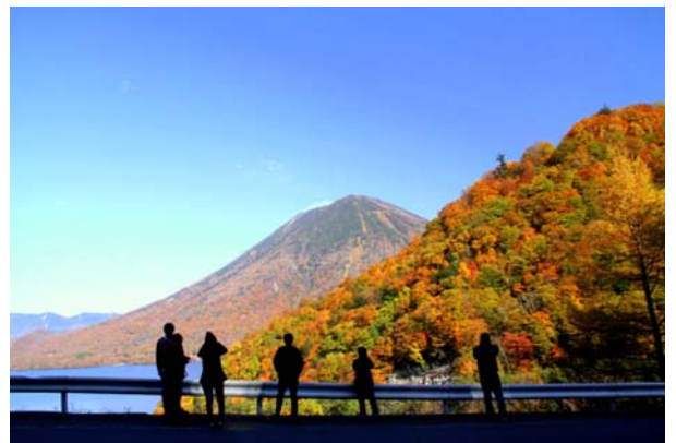
10/27 中宮祠足尾線紅葉 10分