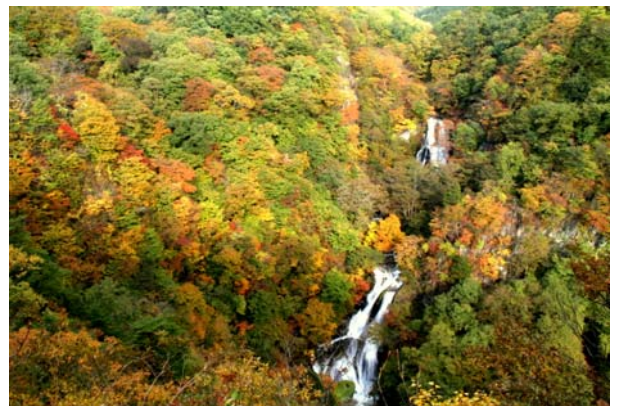
10/27 霧降滝 紅葉 6分