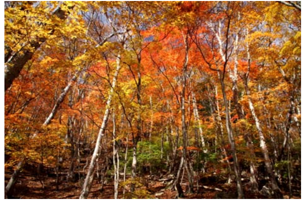
10/26 菖蒲ヶ浜付近紅葉(全体 12分)