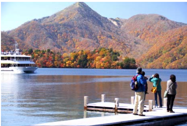
10/27 八丁出島 11分(イタリア大使館別荘)