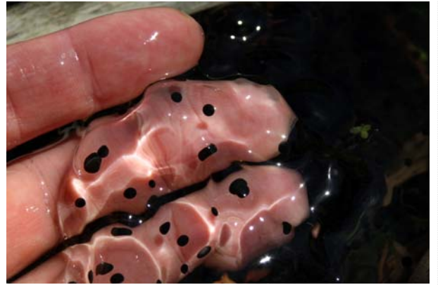
4/4 ヤマアカガエル卵塊(湯元)