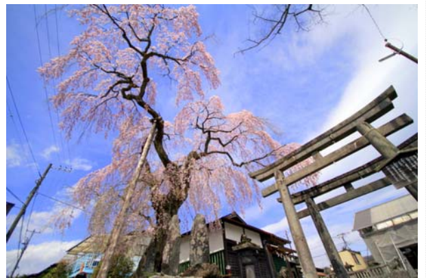
4/6 虚空蔵の枝垂れ桜 (市街地)