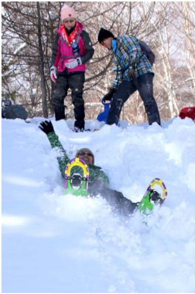
1/1 スノーシューツアー開始