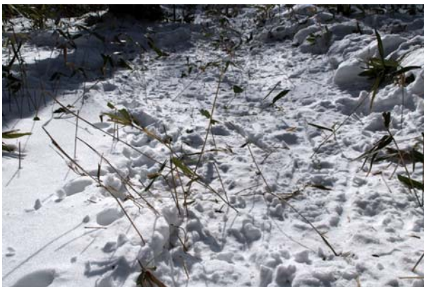
1/16 スノーシューの踏み荒らし (湯滝)