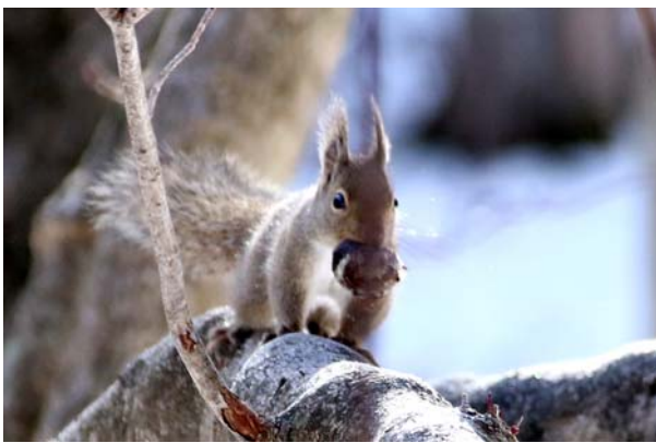
1/14 リス (中禅寺湖・阿世瀧)