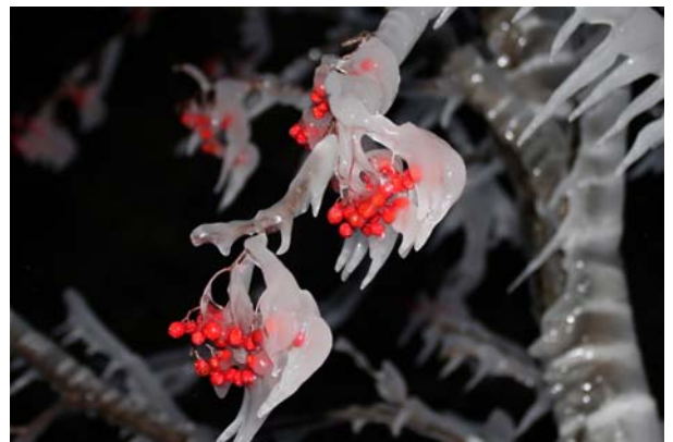
1/18 飛沫氷 (中禅寺湖・立木駐車場)