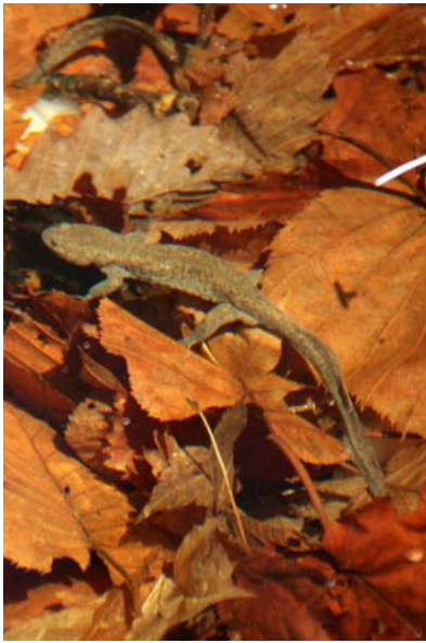
4/28 クロサンショウウオ (千手)