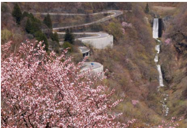
5/4 オオヤマザクラといろは坂 (明智平)