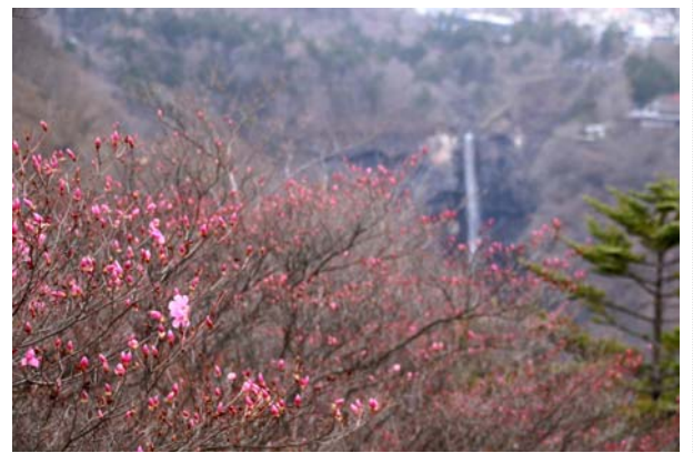
5/4 アカヤシオと華厳滝 (明智平展望台付近)