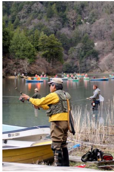
5/1 湯ノ湖・湯川釣り解禁