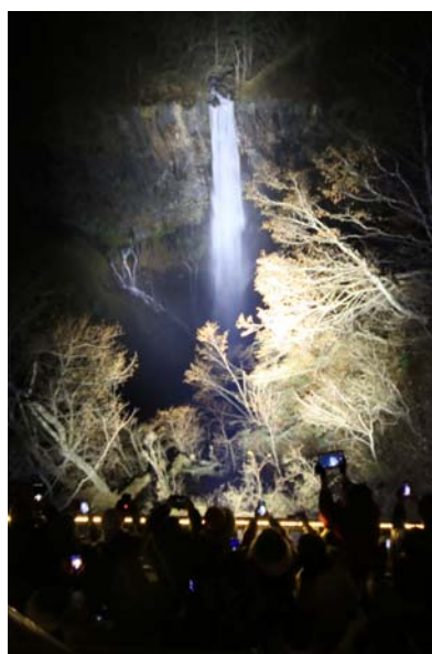
11/16 華厳滝ライトアップ