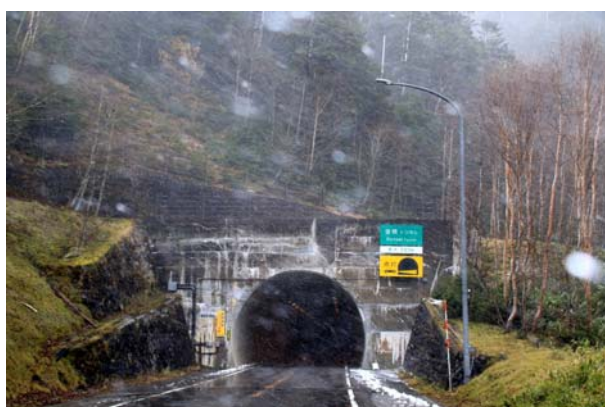
11/12 除雪の痕跡・吹雪（金精トンネル）