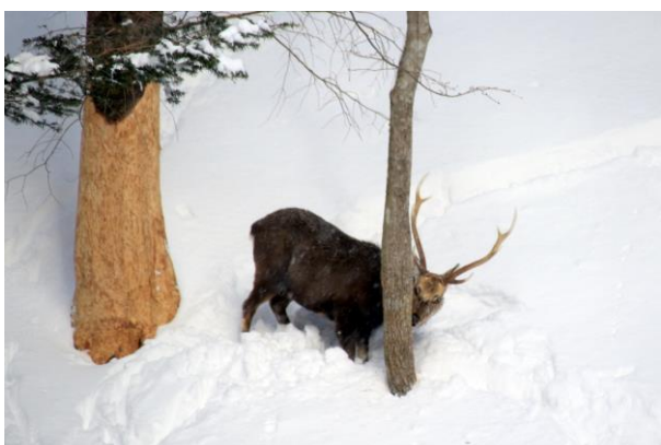
2/18 樹皮を食べるニホンジカ (弓張峠)