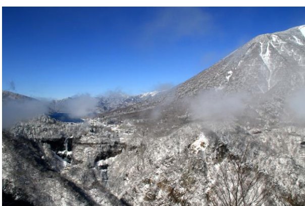
2/11 明智平ロープウェー