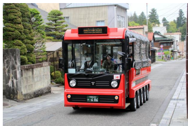
4/29 グリーンスローモビリティ（西町）