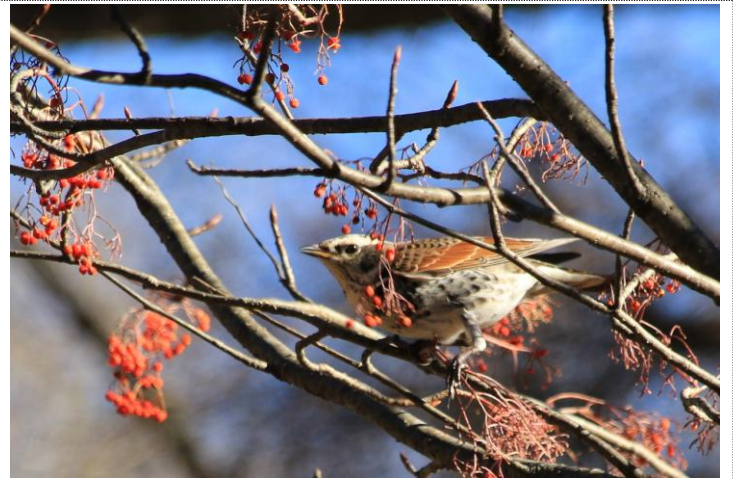
11/29 ツグミ (小西ホテル前)