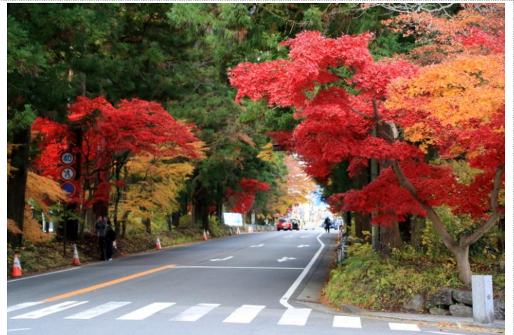
11/26 紅葉 (JR 日光駅前 国道 119 号)