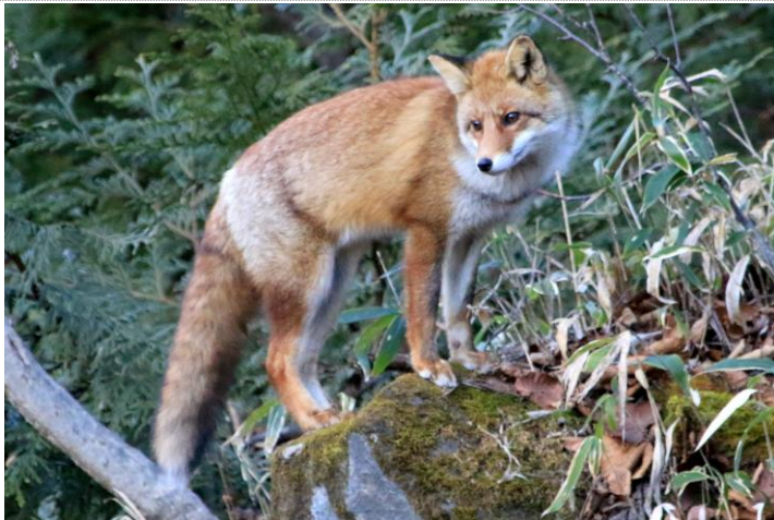
11/24 キツネ (湯ノ湖)