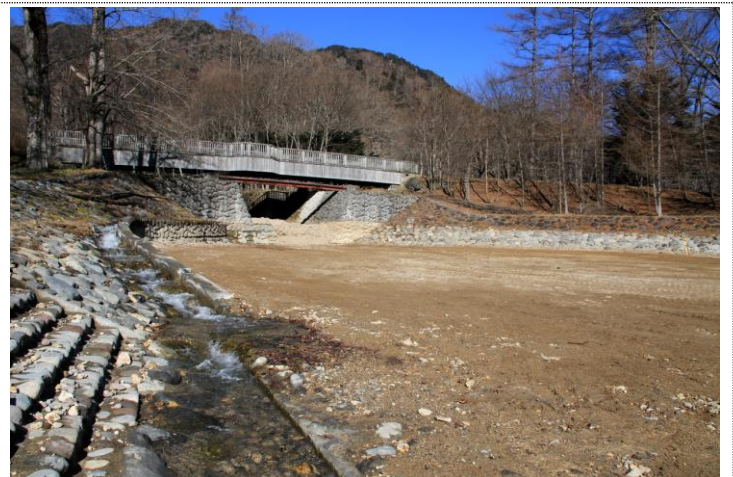
11/29 白根沢土砂除去と現れた魚道 (湯元地内)

【概略】 11/26 には神橋の紅葉もまだ美しかったが、11/29 には既に葉を落としていた。日光の紅葉も終わり、あとは冬を待つばかり。これまでも記載のように、湯元では時折雪が積もる。11/29 朝、日光市街地から湯元までの幹線には雪や凍結は見られなかったが、湯元地内の日陰では路面凍結が消えなかった。湯ノ湖畔の水際では、陽射しが当たっても氷が解け切らなくなった。湯ノ湖に注ぐ白根沢の土砂除去では最大で 1.7m 程の深さが除去され、魚道が現れた。12/1 には東武バスが冬季ダイヤになり、大使館別荘も冬季休館など、各所冬仕様になるので注意。