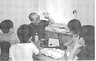
アカデミック・ロードは、小学生のクラスでは英語を聞いて覚えることを重んじる

《企業概要》 2014年5月 35万円 35万人 栃木県小山市中央町2 の2の20 メゾン小 山203 3500万円 (17年3月期、見直し) 英語塾「アカデミック ロード」の運営